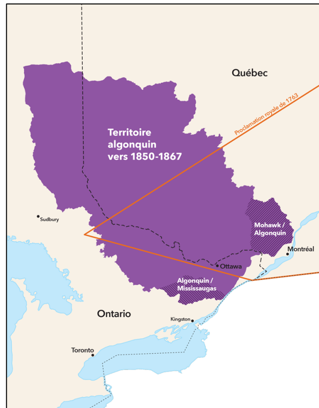
Carte 1. Représentation du territoire de la Nation algonquine vers 1850-1867